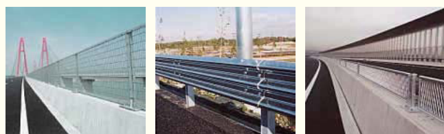
落下物防止フェンス ガードレール 防眩フェンス